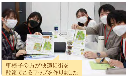
車椅子の方が快適に街を散策できるマップを作りました

配属地域を深く理解し、考え、自分ができることを実践する、という課題に取り組みました。グループで知恵を出し合い、一つの答えを生み出しました。