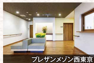
プレザンメゾン西東京