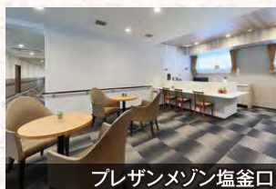
プレザンメゾン塩釜口